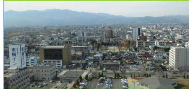
【コラッセふくしまから中央西地区を望む】