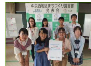
【三河台リーダーズクラブのみなさん】