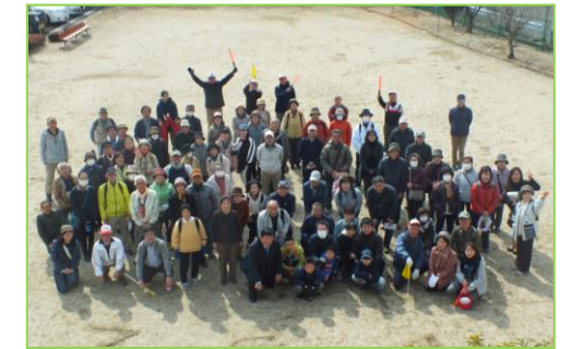
【みんなで歩こう三河台参加者】