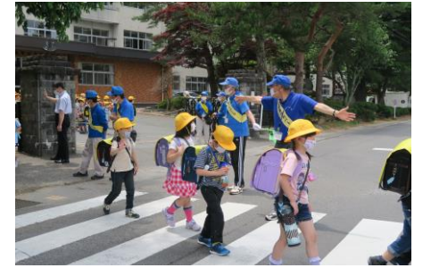
【子どもサポート会の活動】