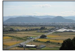
塩竈神社の境内から見た田園風景