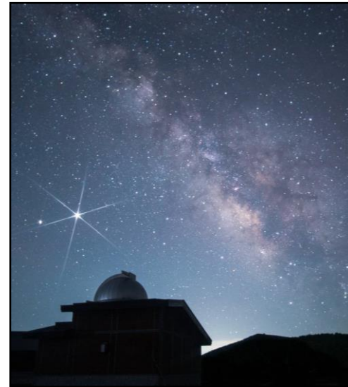
【浄土平天文台と天の川】