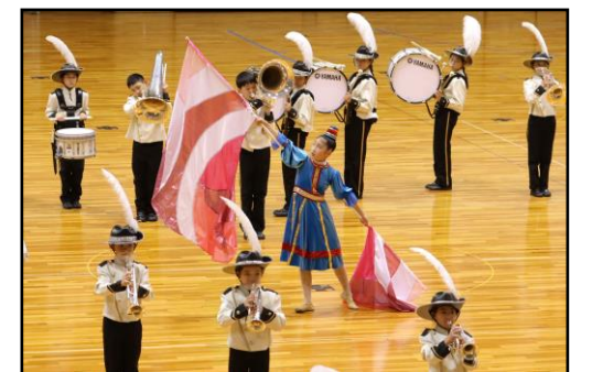
【野田小学校マーチングクラブ】