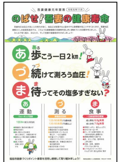
【のばせ! 吾妻の健康寿命】