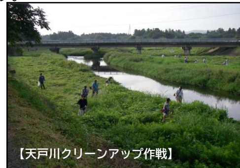
【天戸川クリーンアップ作戦】