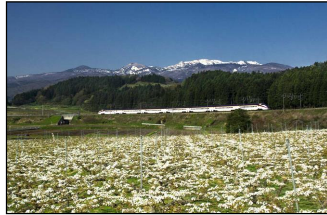
【梨の花と山形新幹線と吾妻小富士】