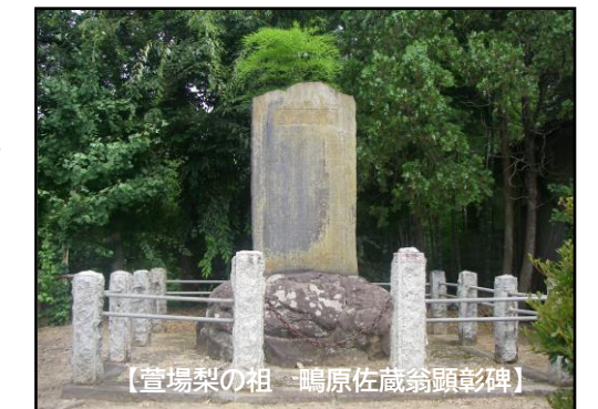
【萱場梨の祖 鶴原佐蔵翁顕彰碑】