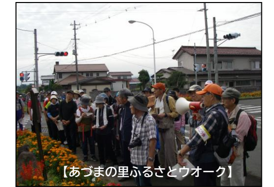
【あづまの里ふるさとウォーク】