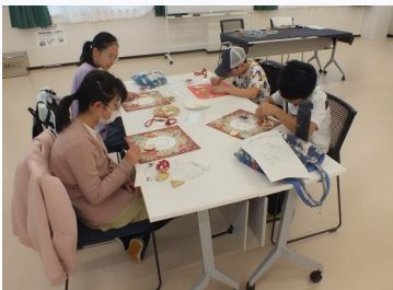
クリスマスパーティー