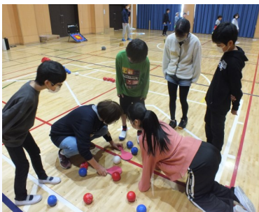
ニュースポーツ体験