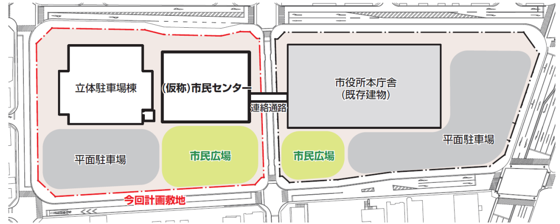
敷地全体のゾーニングイメージ