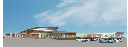
地域振興施設「道の駅」イメージ図