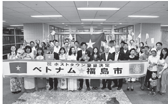
ベトナムのホストタウンに登録決定

野球・ソフトボール競技の開催に向けた準備やホストタウン交流の推進、事前合宿の誘致、大会機運の醸成などの事業の実施を通じ、本市のスポーツの振興や教育・文化の向上、共生社会の実現、交流人口の拡大に努めた。