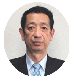
山本 克也 副市長