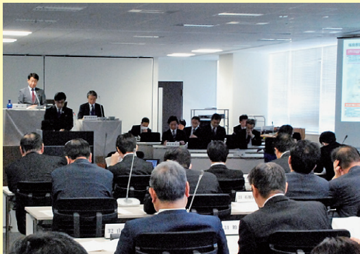
全員協議会の様子