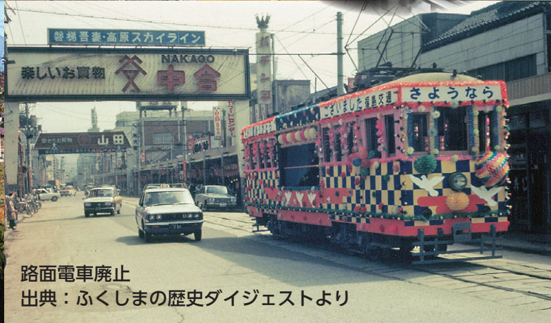
路面電車廃止