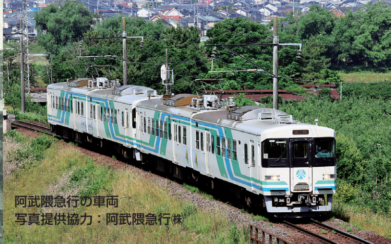
阿武隈急行の車両