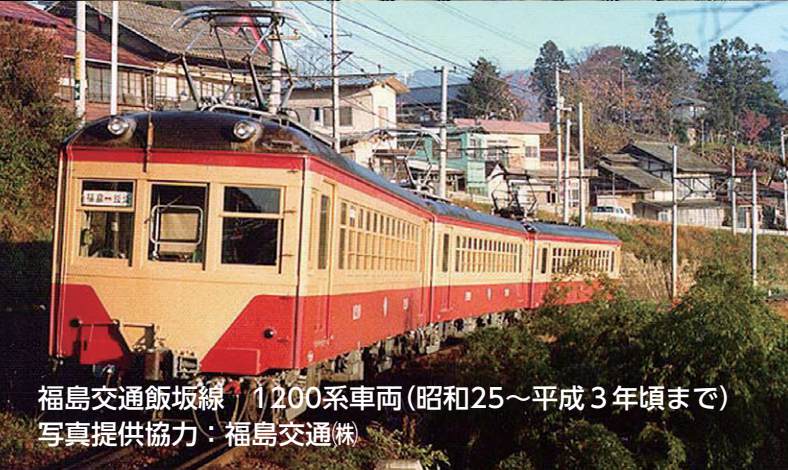
福島交通飯坂線 1200系車両(昭和25～平成3年頃まで)