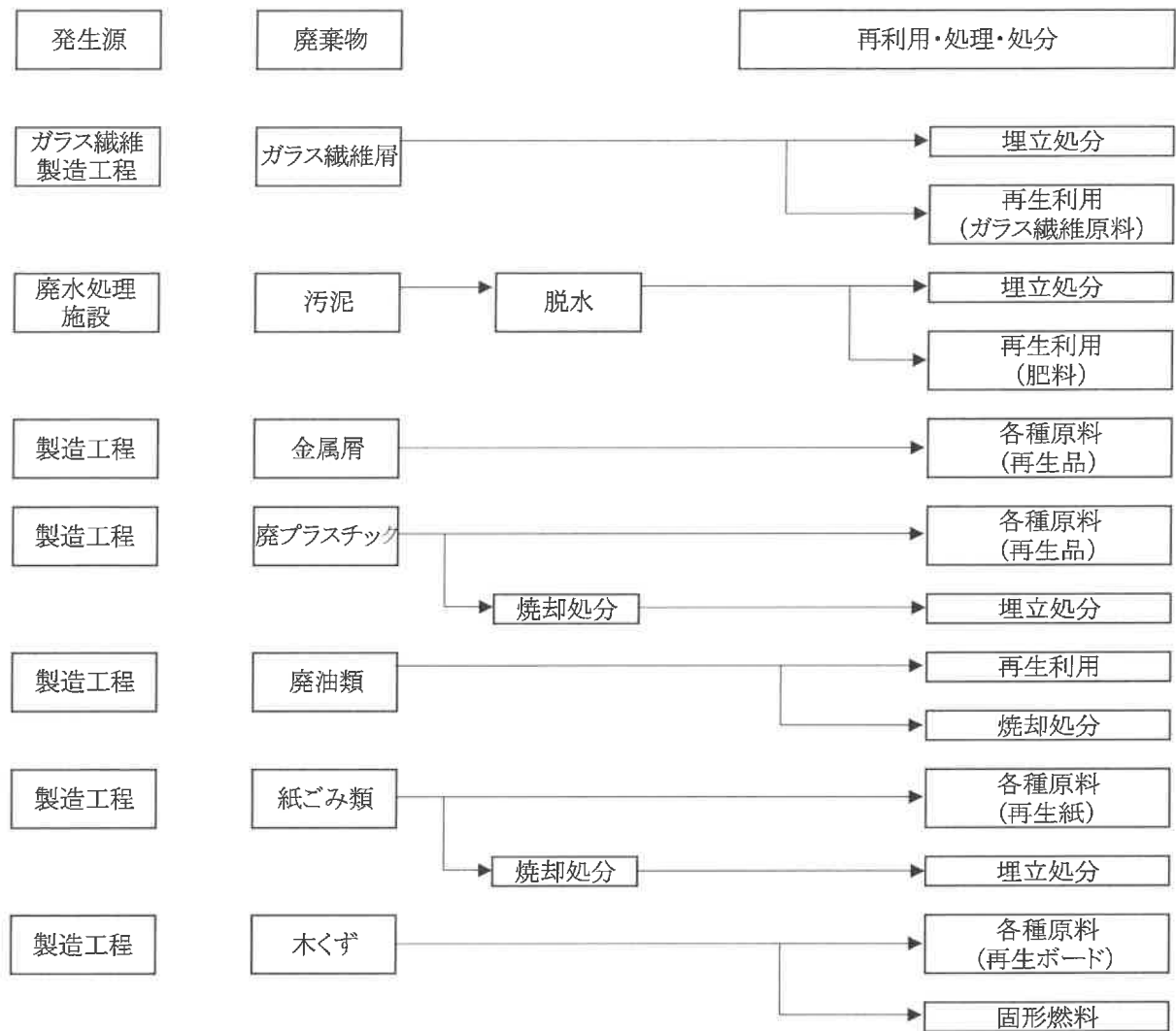
【別紙-1】廃棄物処理フロー図