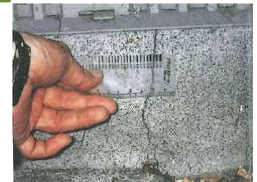
クラックスケールによる 基礎のひび割れ幅の計測