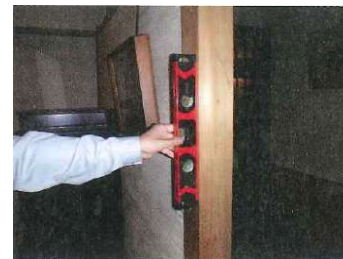
水平器による 柱の傾きの計測