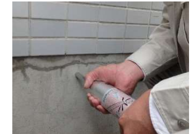
リバウンドハンマーを用いた コンクリートの圧縮強度の測定

※調査内容の合理化（配筋調査及びコンクリート圧縮強度試験の省略）や調査手法の多様化（デジタル調査の活用）の観点から、既存住宅状況調査方法基準（告示）を改正〔令和5年4月施行〕