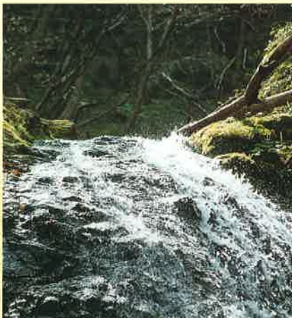
きれいで安全な水をいつまでも