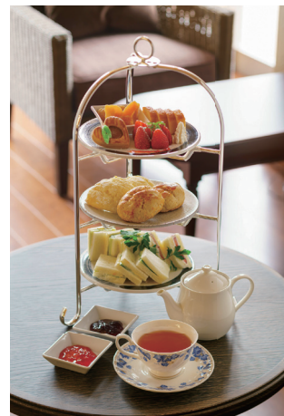
▲アフタヌーンティーのイメージ