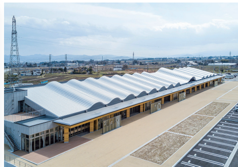
▲道の駅国見あつかしの郷