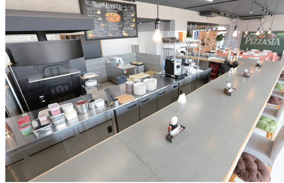
▲レガーレ こおり内「PizzaStia」