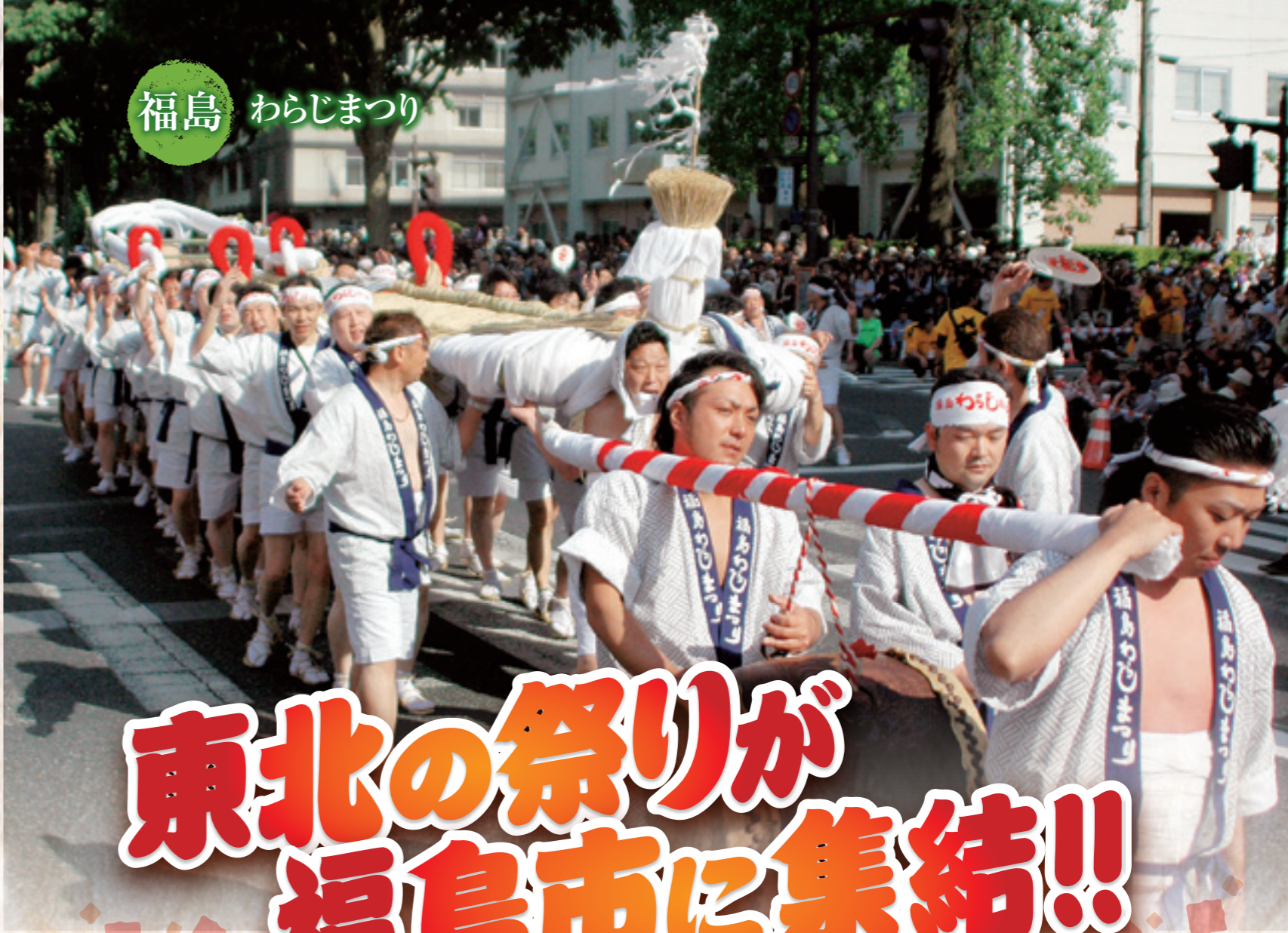
福島 わらじまつり