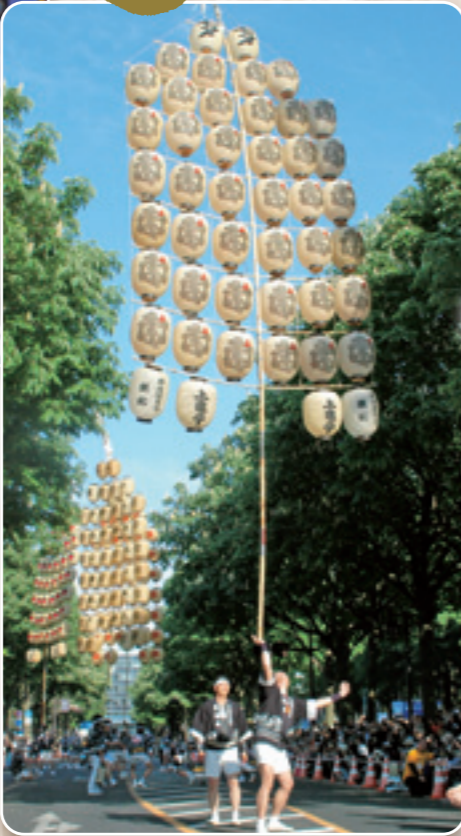
秋田 かんどう 竿燈まつり