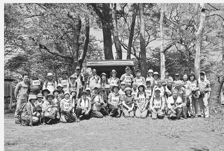
▲十万劫「雷神神社」の前で

昼食休憩をはさみ、山中で草花の説明を受け ながら無事学習センターへ到着いたしました。 参加された皆さん、お疲れ様でした。