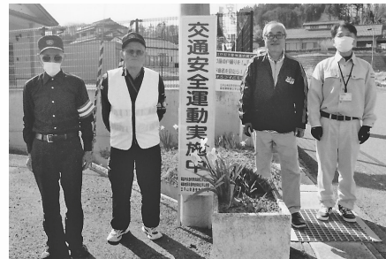
交通関係団体の皆さんで看板を設置しました。

地区のみなさんも事故にあわないよう、事故を起こさないよう、お互いに交通安全に努めましょう。