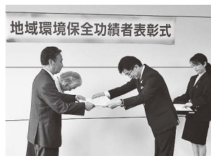
※木幡市長より表彰状の授与