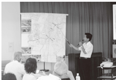
▲地域の課題を詳細に訴える委員