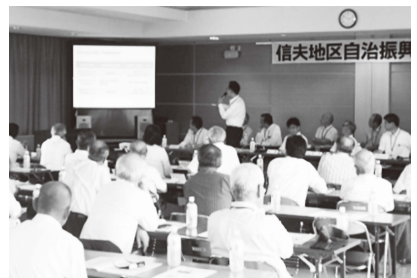
▲課題に対して市当局の考え方を説明