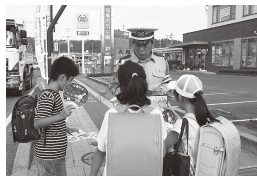
【街頭啓発活動の様子】