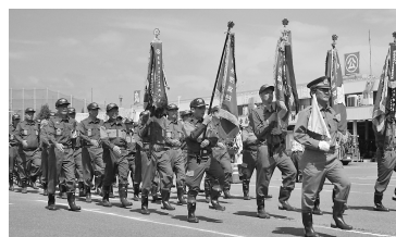
検閲式(行進)の様子