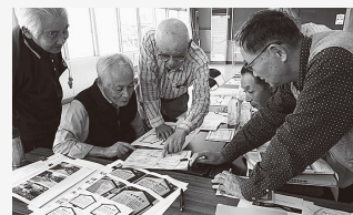
▲熱心に説明内容を検討する歴史愛好会の皆さん