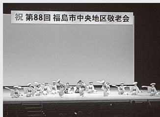
▲華を添えたステージ(写真は里の子会による踊り)