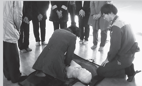
▲救急救命法訓練の様子