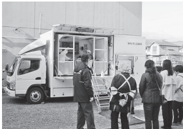
起震車体験の様子