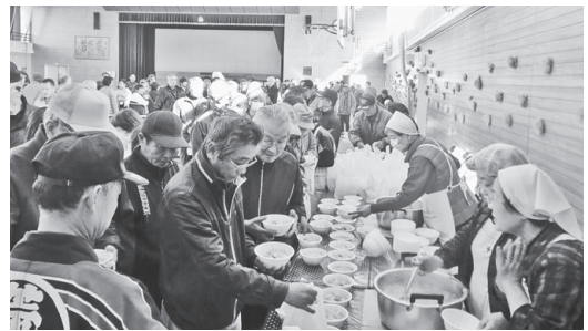
炊出し訓練の様子