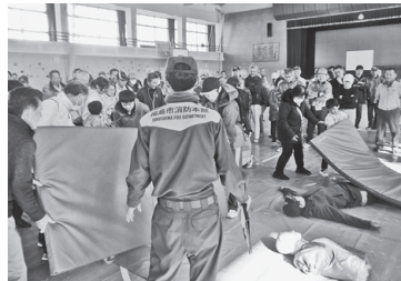
総合訓練のけが人を救出、応急手当を行う様子