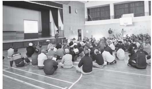
信夫分署長の防災講話の様子

訓練後には、地元赤十字奉仕団とJA女性部の皆さんによる、おいしい豚汁がふるまわれました。