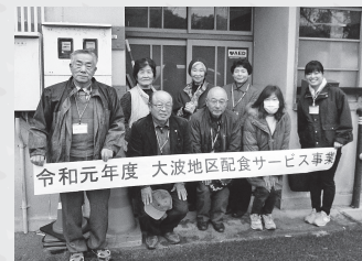
令和元年度 大波地区配食サービス事業

福島市社会福祉協議会 大波協議会では、12月5日(木)、大波地区にお住いの満70歳以上の一人暮らしの方と、満75歳以上の高齢者のみの世帯の希望者を対象にした配食サービスを実施しました。同会役員と民生児童委員が昼食弁当を配達しながら声掛けし、皆様のお元気な姿を確認しました。