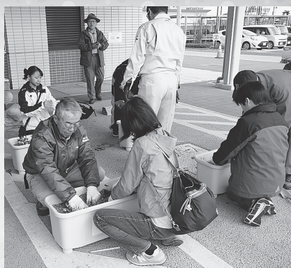
▲子どもから大人まで心を込めて一緒に花苗を植えました