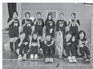
優勝した第三地区体育協会のみなさん

11月3日(日)、毎年度恒例の中央地区体育協会対抗親善家庭バレーボール大会が開催されました。