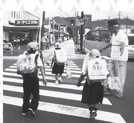
▲③交通事故防止活動の様子