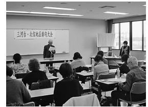
平成31年三河台・北信俳句大会の様子