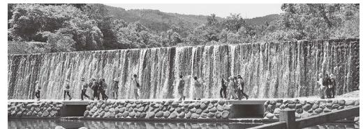
昨年のあらかわ・ふるさとの川ウォーキング