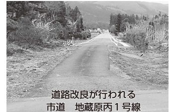
道路改良が行われる 市道 地藏原丙1号線