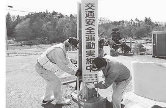
啓発看板を設置しました。

地区のみなさんも事故にあわないよう、事故を起こさないよう、お互いに交通安全に努めましょう。