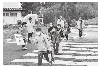
街頭指導を実施しました。