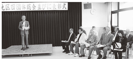
▲功労者表彰式の様子