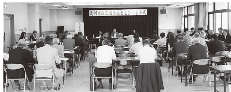
▲自治振興協議会総会の様子