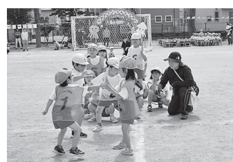
9月28日 杉妻幼稚園運動会