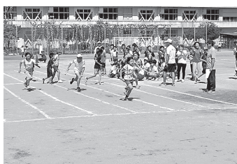
9月15日 杉妻地区大運動会