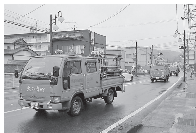
【昨年の防火パレードの様子】