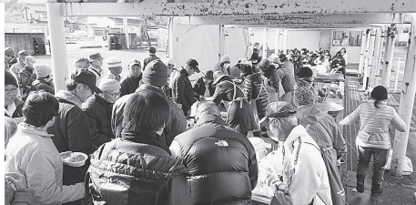
炊き出し訓練 (昨年度)