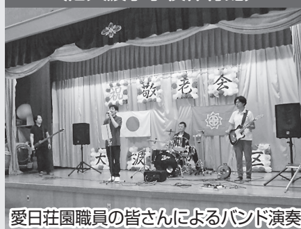
愛日荘園職員の皆さんによるバンド演奏