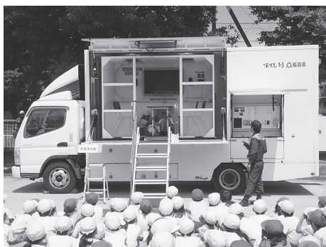
起震車による 地震体験