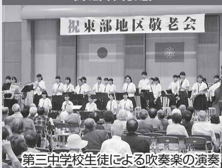
第三中学校生徒による吹奏楽の演奏