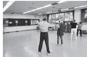
「渡利吹矢クラブ」活動のようす