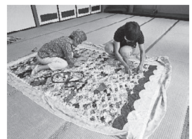
「ジャングルポケット」 (パッチワーク)活動のようす