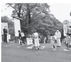
朝の街頭指導風景

交通対策協議会立子山支部、交通安全協会立子山支部、立子山小・中学校PTAの皆さんのご協力のもと、交通安全啓発立て看板の設置や通学路での朝の街頭指導及び地区内の広報活動を実施し、交通事故防止を呼びかけました。