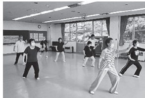
「渡利太極拳愛好会」活動のようす

「いわゆる3密を避けるため、学級生を2つに分散させて別な日に同一内容で学習会を行っています。」