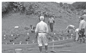
第4行政区の皆さんの活動の様子

水やりや草むしりなど日頃の地道な活動が、美しく花開き、人々の心をなごませてくれます。