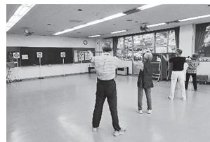
「渡利吹矢クラブ」活動のようす