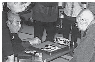
▲オセロで真剣勝負

渡利地区内では13の老人クラブが活動中です。地域の美化活動や親善旅行、お楽しみ会など、皆さんで楽しく元気に活動しています！