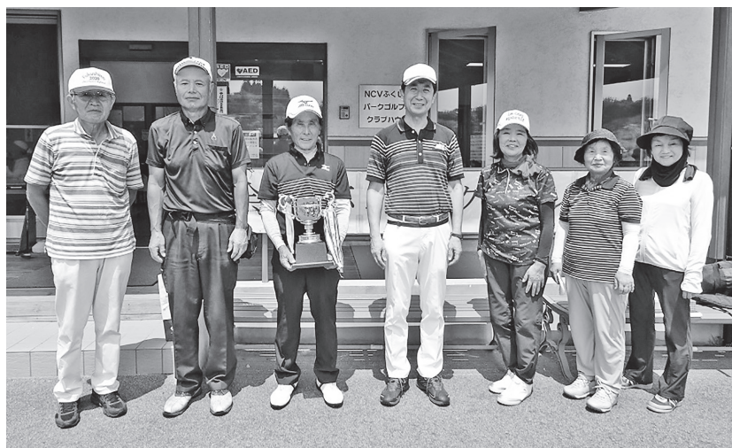
半澤会長(中央)と男女第三位までの入賞者