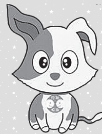
行政相談マスコット 「キクーン」

内容／役所(国の行政など)や年金事務所、郵便局などの仕事について、対応や説明に納得できないなどの「意見・要望や苦情」などを、福島市担当行政相談委員がお聞きします。新型コロナの対策上、相談者の氏名などの確認・相談中のマスク着用・相談時間おおむね30分以内のご協力をお願いいたします。