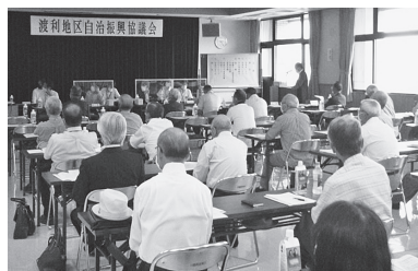
▲地区の代表の皆さんから、さまざまな意見が出されました。

渡利地区の天神橋から国道4号までの区間につきましては、渡利地区と中心市街地を結ぶ重要な路線と考えておりますが、現在事業中の路線の進捗と、交通ネットワークの整合性や緊急性などを十分に踏まえた中で整備時期について検討してまいります。