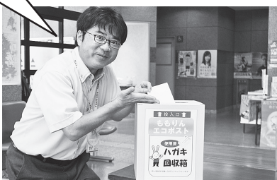
▲エコポストは支所カウンターに備えてあります。