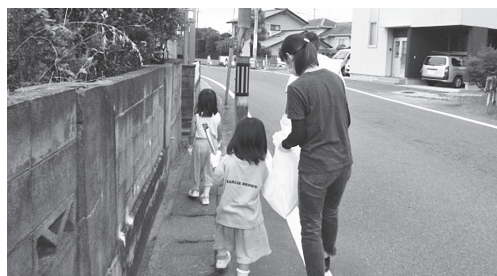
▲普段何気なく通っている道路。空のペットボトルなどが捨ててありました。

各町内会の子供会の皆さんや民生委員の皆さんなど約60人が参加し、渡利学習センターから渡利支所までの県道や阿武隈川堤防などのごみ拾いに汗を流しました。地域活動を通じて親子のコミュニケーションも図ることができました。