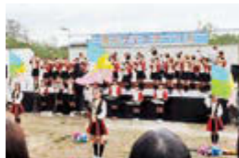
▲オープニングセレモニーでは吉井田小学校マーチングバンド部が演奏披露

時 午前10時～午後2時 場 荒川桜つつみ河川公園・荒川河川敷 ※会場のコンディションにより、吉井田支所などに変更になる場合があります。 問 河川課 ☎525-3756 キーワードラリー 会場内のチェックポイントをめぐってキーワードを集めよう！(小学生以下対象、先着50人に景品プレゼント) 午前11時から本部で台紙を配布 花の苗プレゼント(先着200人) 午前11時から配布 各種コーナー ・芸能まつり ・はたらく車展 ・降雨体験装置 ・フリーマーケット