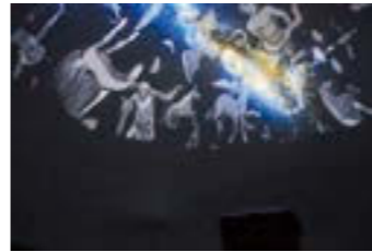
▲ドーム内でのプラネタリウムの上映イメージ

時 午前10時～午後3時 場 じょーもぴあ宮畑 ☎573-0015 弓矢、火起こしなどの縄文人体験、案内ガイド、フリーマーケット、物産販売など内容盛りだくさん！ エコバッグ作り 園内を巡りながら土器や土偶のスタンプを押して、オリジナルデザインのバッグを作ろう！ アトラクション 直径5mの仮設ドームによるプラネタリウムの解説(20分) ①午前10時30分②午前11時5分③午前11時40分④午後1時15分⑤午後1時50分⑥午後2時25分 ※開始30分前に体験学習施設受付にて整理券配布。