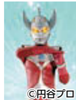
▲ウルトラマンタロウ

①午前11時②午後2時 よさこい演舞 ①午後1時②午後3時 ☆5日(祝・土)☆ こいのぼり障害物競争 ①午前10時30分 ②午後1時 ウルトラマンタロウ 握手&撮影会 ①午前11時 ②午後2時