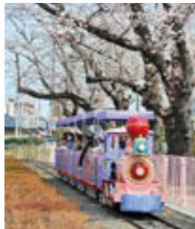
▶豆汽車「わくわくトレイン」など、大型遊具に乗って楽しもう

時 午前9時30分～午後4時30分 場 福島児童公園SFCももりんパーク ☎572-3575 ※公共交通機関をご利用ください。 ☆3日(祝・木)☆ 風船プレゼント 小学生以下対象、先着200人 ももりんとじゃんけん大会 ①午前11時②午後2時 余目一輪車クラブ一輪車ショー 午前11時30分 演技披露、体験会 ミニ縁日 ☆4日(祝・金)☆ 似顔絵コーナー(有料) 午前10時～午後3時 ☆5日(祝・土)☆ 営業時間内 大型遊具 無料！