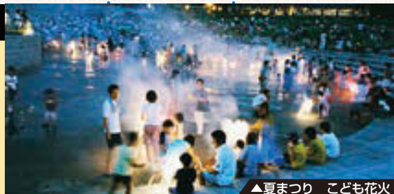
▲夏まつり こども花火