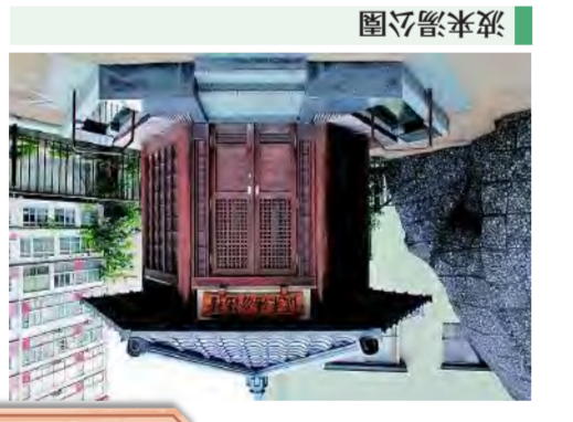
足湯で気軽に温泉タイム