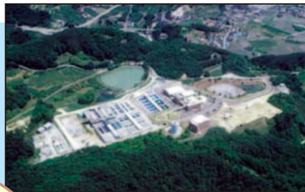
すりかみかわ 摺上川ダム