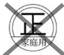
家庭用計量器の印