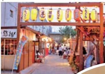
ふくしま屋台村 ころんしよ横丁