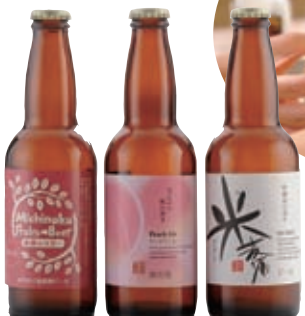
林檎のラガー・ピーチエール・米麦酒