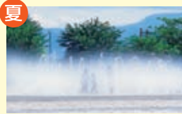
十六沼公園で水遊び