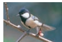
【市の鳥】シジュウカラ