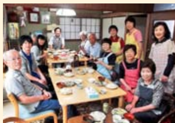
「やってみっ会」の様子

「認知症カフェ」は、認知症の人やその家族、各専門家や地域住民がお互いに交流したり、情報交換することを目的に開催しています。他の人の体験談から学べたり、息抜きができた、相談することで気持ちが楽になったりします。