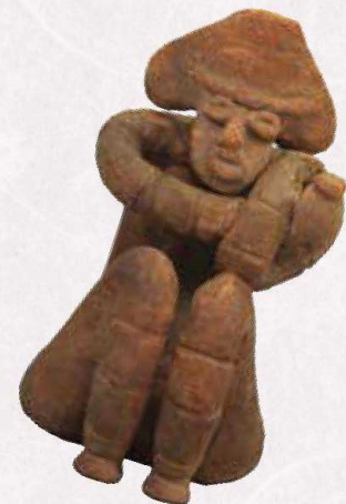
重要文化財 「しゃがむ土偶び〜ぐ〜」