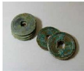
近世墓から出土した古銭

国道13号線の延伸事業に伴い発見された遺跡です。平成29、30年度に試掘調査が実施され、平安時代の須恵器・土師器が出土しました。令和元年度の調査では、主に平安時代の住居跡や、掘立柱建物跡、鍛冶関連遺構が見つかり、墨書土器も出土しています。また、平安時代~中世頃と考えられる墓からは副葬品として烏帽子が出土しました。令和2年度の調査では、近世の墓や縄文時代と考えられる落とし穴跡、旧石器時代の石器が発見されています。