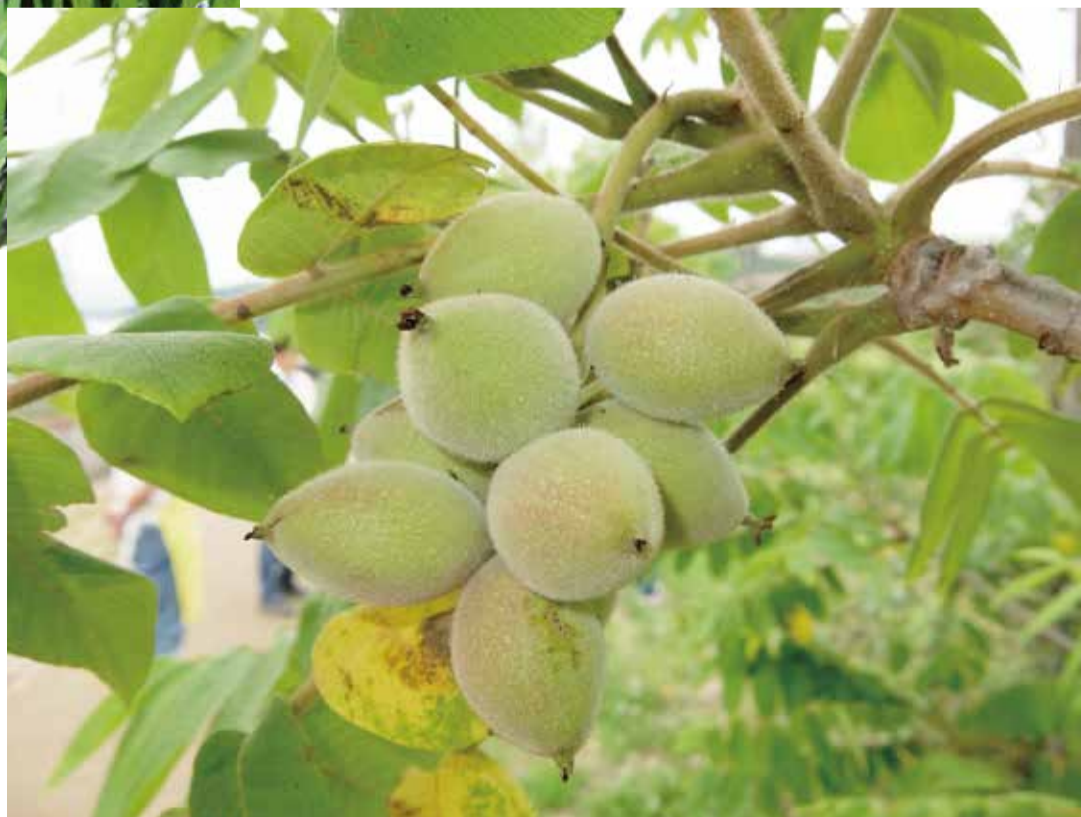
クルミの実がふくらみ始めました