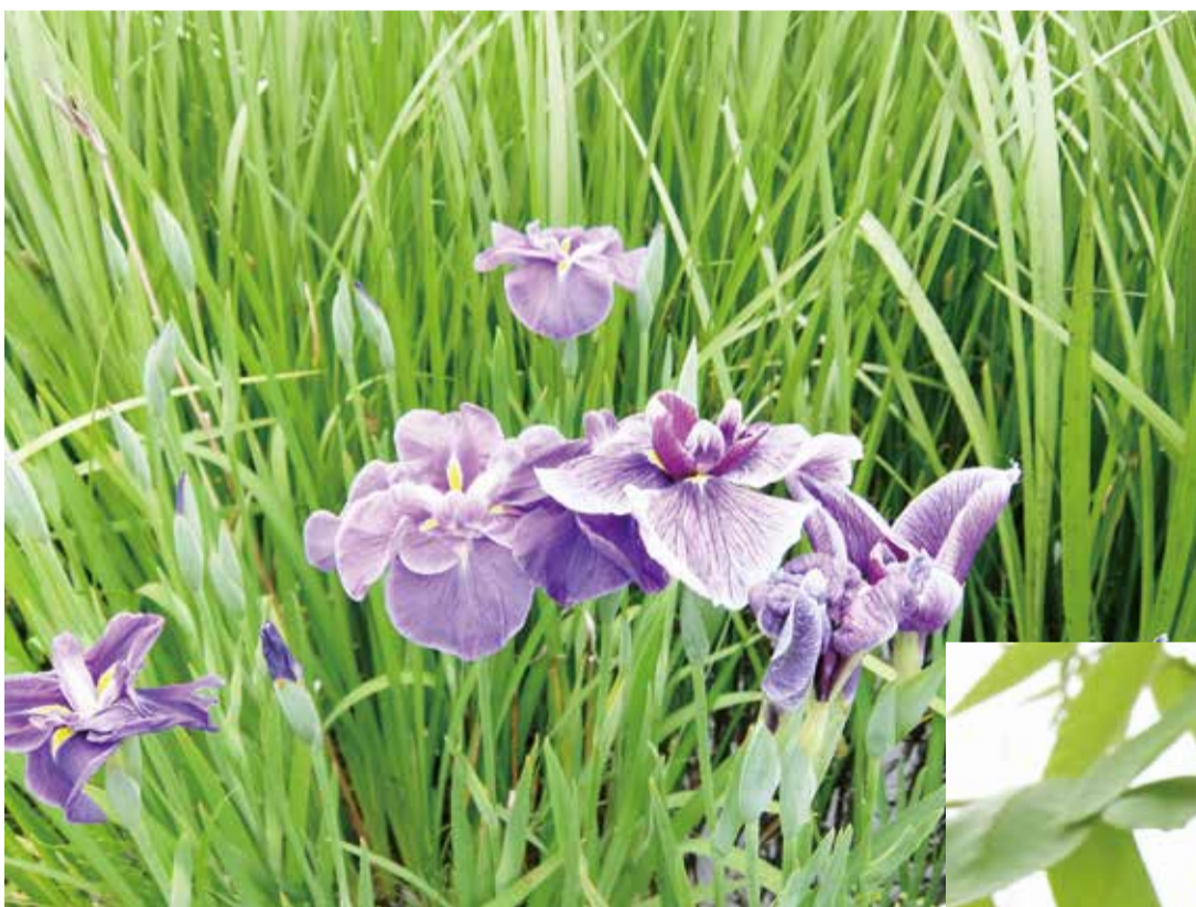
花菖蒲が見ごろになりました