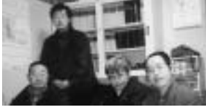
身体障害者自立支援センターのみなさん

下は狭くて車椅子と歩行者が並ぶと危険。駐車場もほしい。みんなが快適に暮らしていくために障がい者だからと諦めないで社会の一員として発言したいと思っています。