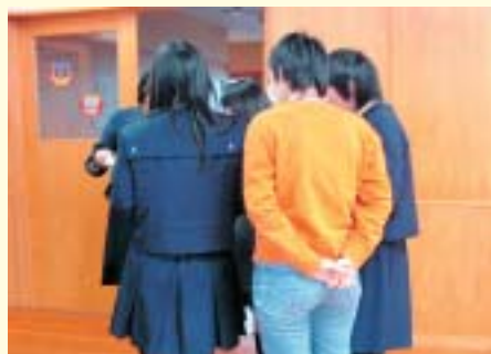
女子校時代のセーラー服、まったくの私服など、生徒の着ているものはさまざま。

制服、あるいは標準服というものは、学校の教育理念の反映だと思えます。本校は女子校だったからこそ、意識的にジェンダーフリーを指した教育活動を行ってきました。その精神を表現するのに最もふさわしいと考えたのが「男女同型のブレザーのみ」というスタイルだったのです。